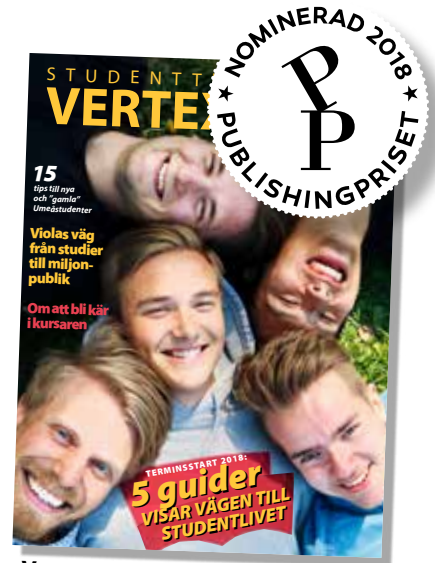
Vertex nr 4-2018.